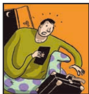
Page 5 JE SUIS ABSENT