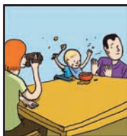
Page 21 SOUVENIRS NUMÉRIQUES