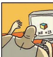
Page 15 LE TEST DE QI