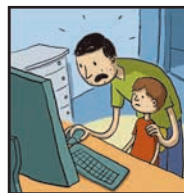
Page 9 PIÈGES À MÔMES