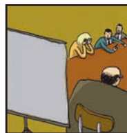
Page 11 L'HISTOIRE SANS FIN