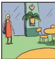
Page 7 LE RENDEZ-VOUS