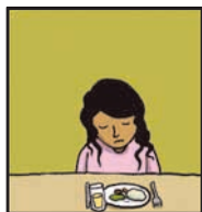
Page 19 LE PROBLÈME