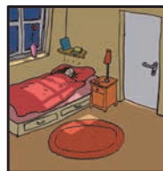
Page 23 ACCÈS NON SÉCURISÉ